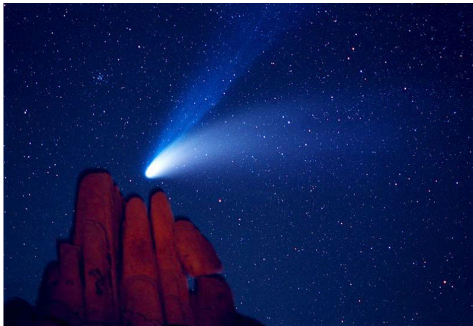
Figura 5.1.: El cometa Hale-Bopp fotografiat el 1997 des del Joshua Tree National Park, USA.

El següent codi, per exemple, inclou una fotografia i l'escala per tal que faci exactament un 80% de l'ample de la pàgina. El resultat és la figura 5.1 d'aquest document.